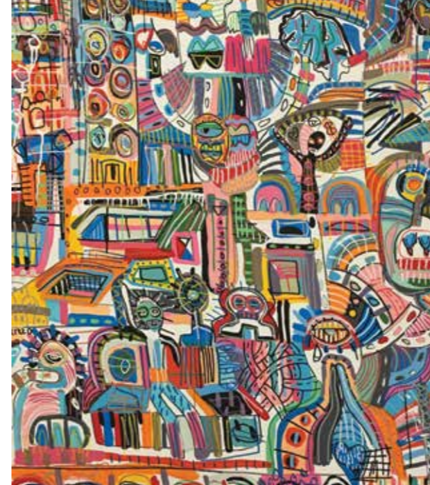
Skizzo, „o.T.“ , 2018, Mischtechnik auf Leinwand, 120 x 100 cm, Galerie Rosemarie Bassi, Remagen/DE