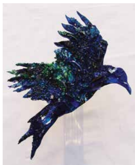
Johann Lengauer „Achtsamkeit“ , 2010, Glas/Acryl/Holz, 43 x 35 cm, Galerie Rosemarie Bassi, Remagen/DE