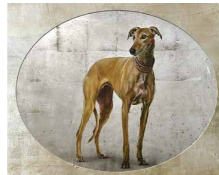
Enrique Gonzalez „LEVREL OVALDO“ 2019, Blattgold und Öl auf Leinwand, 88 x 107 cm, Galeria Rodrigo Juarranz, Aranda de Duero/SP

Die ART SALZBURG CONTEMPORARY & ANTIQUES INTERNATIONAL zeigt internationale zeitgenössische Kunst, Klassische Moderne und Kostbarkeiten des 19. – 21. Jhdt. Galeristen und Kunsthändler aus verschiedensten Nationen präsentieren Gemälde, Originalgraphik, Skulpturen, Fotografie, Neue Medien sowie Design und Möbel.