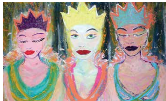
Kiddy Citny, „enfant miraculeux“ , 2017, 90 x 120 cm, Acryl auf Leinwand, Galerie Queenberg, Salzburg/AT