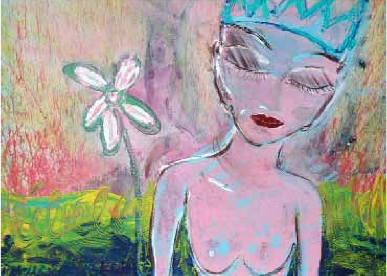
Kiddy Citny, „enfant miraculeux“, 2017, 90x120cm, Acryl auf Leinwand, GalerieQueenberg, Salzburg/AT