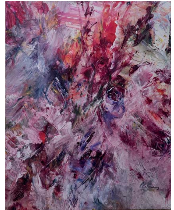
Jutta-Maria Clemens | Frühling | 80x60cm

Galerie Dikmayer Berlin Mitte http://www.galerie-dikmayer.de Gallery 0049-30-23 29 20 60 Mobil 0049-177-2009132 Germany