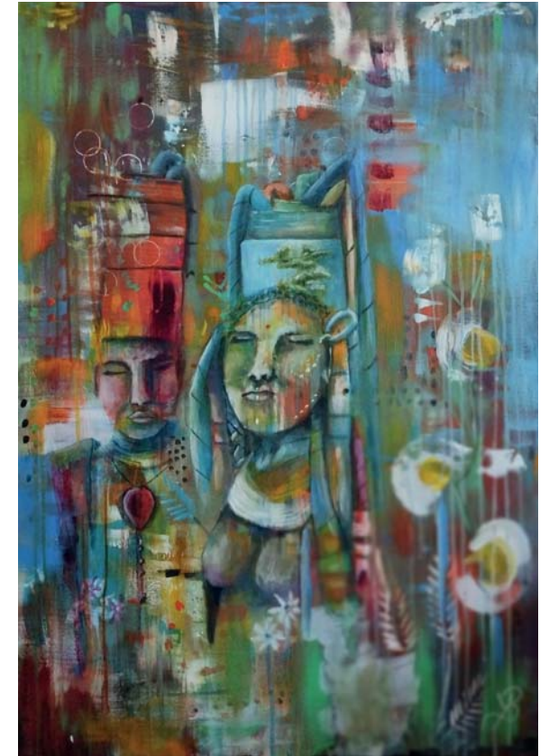
Yvonne Bautz | Kultur | 117x80cm | Acryl 2022

Internationale Messe für zeitgenössische Kunst & Design international exhibition since 1999 Vernissage: 11.05.2024 um 15 Uhr