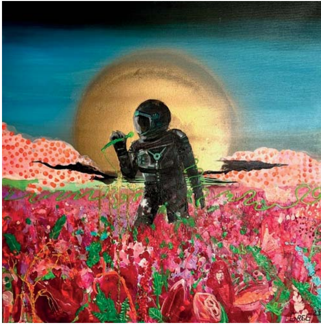
Laura Gregory | Astronaut 8 | Mixed Media/LW | 30x40cm