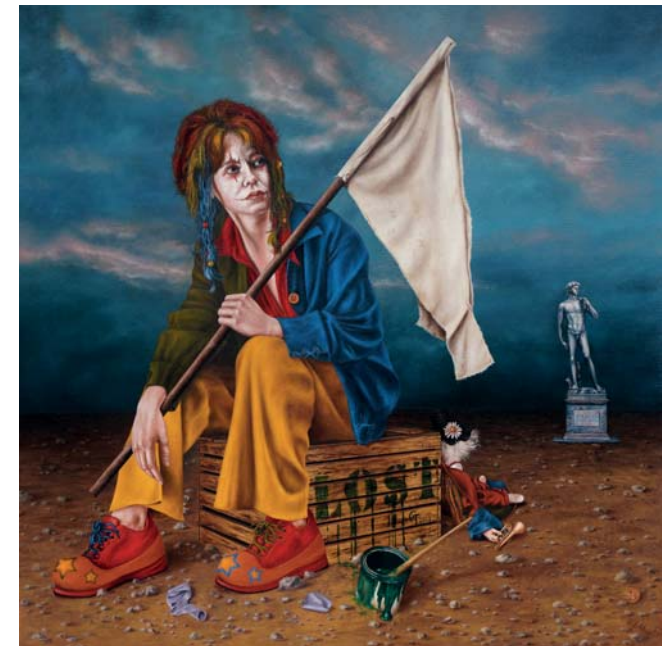
Torsten Gebhardt | Verloren | Öl auf Leinwand | 80x80cm