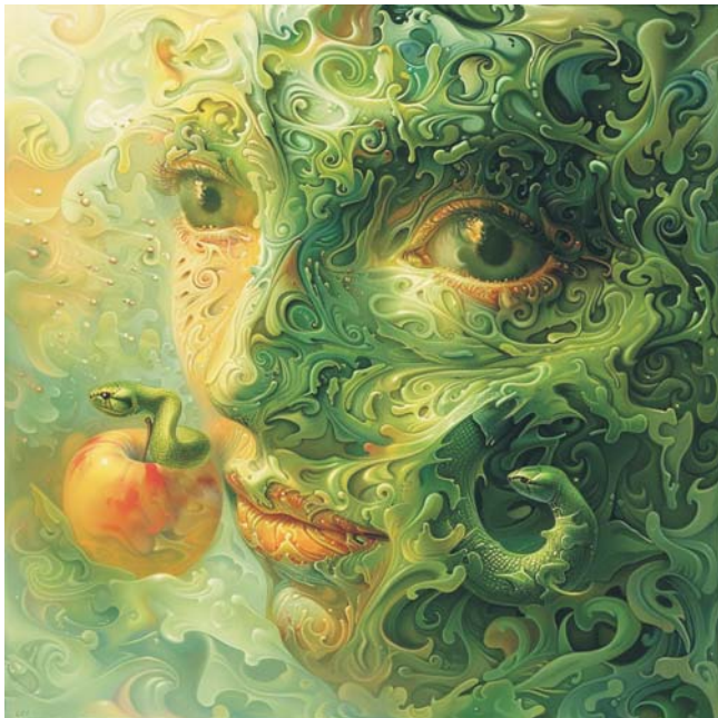
Irina Fedorova | Eva und der süße Apfel | 110x110cm

Herzliche Einladung zur Vernissage am 11.05.2024 um 15 Uhr Atrium Internationales Handelszentrum Friedrichstr. 95 | 10117 Berlin U/S-Bhf Friedrichstraße, Tram, Bus