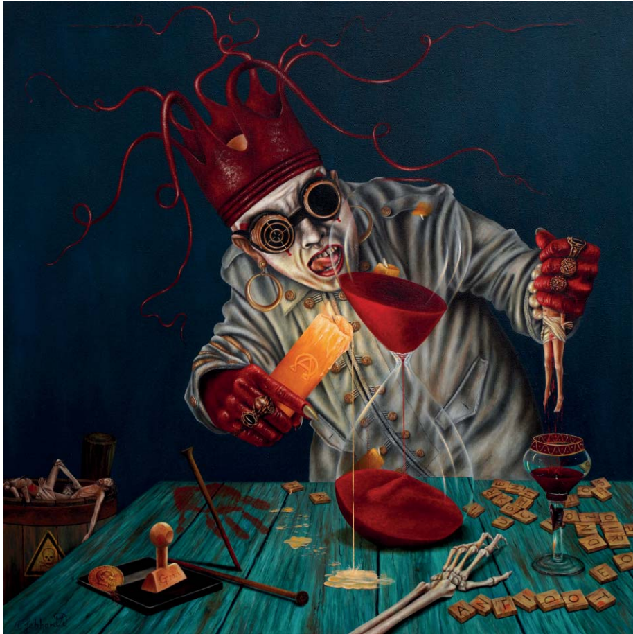
Antidot - Öl auf Leinwand - 80 x 80 cm Antidot - Oil on Canvas - 80 x 80 cm