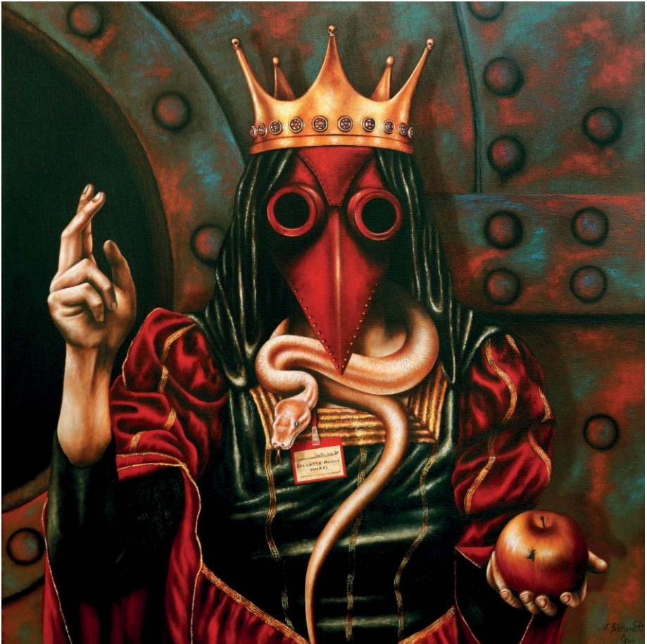
Salvator Mundi - Öl auf Leinwand - 80 x 80 cm

Ich wandere zwischen den Welten und um dabei nicht verrückt zu werden, mache ich Kunst.