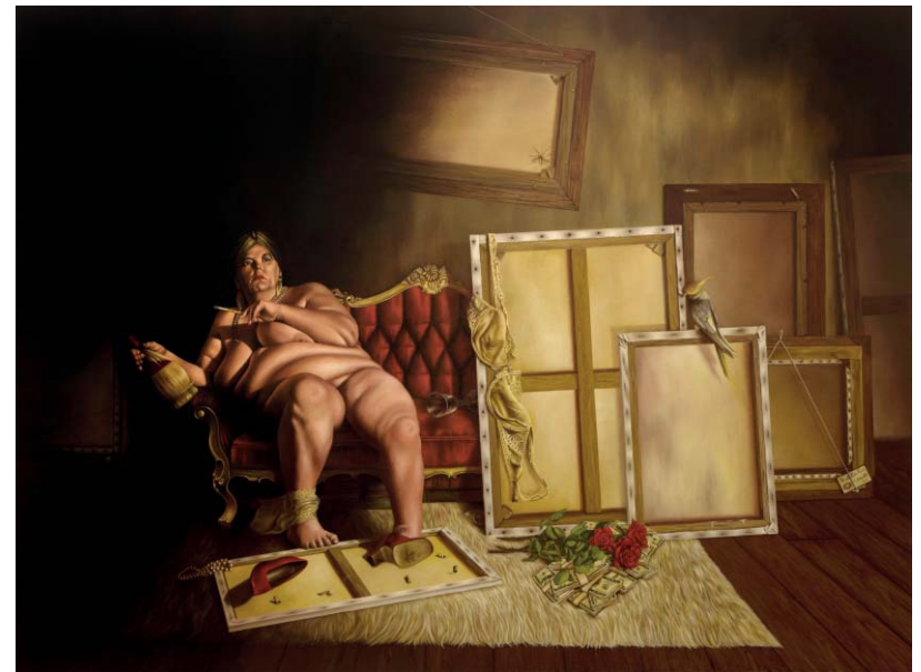
Die alte Hure Kunst - Öl auf Leinwand - 150 x 200 cm The old Harlot named Art - Oil on Canvas - 150 x 200 cm