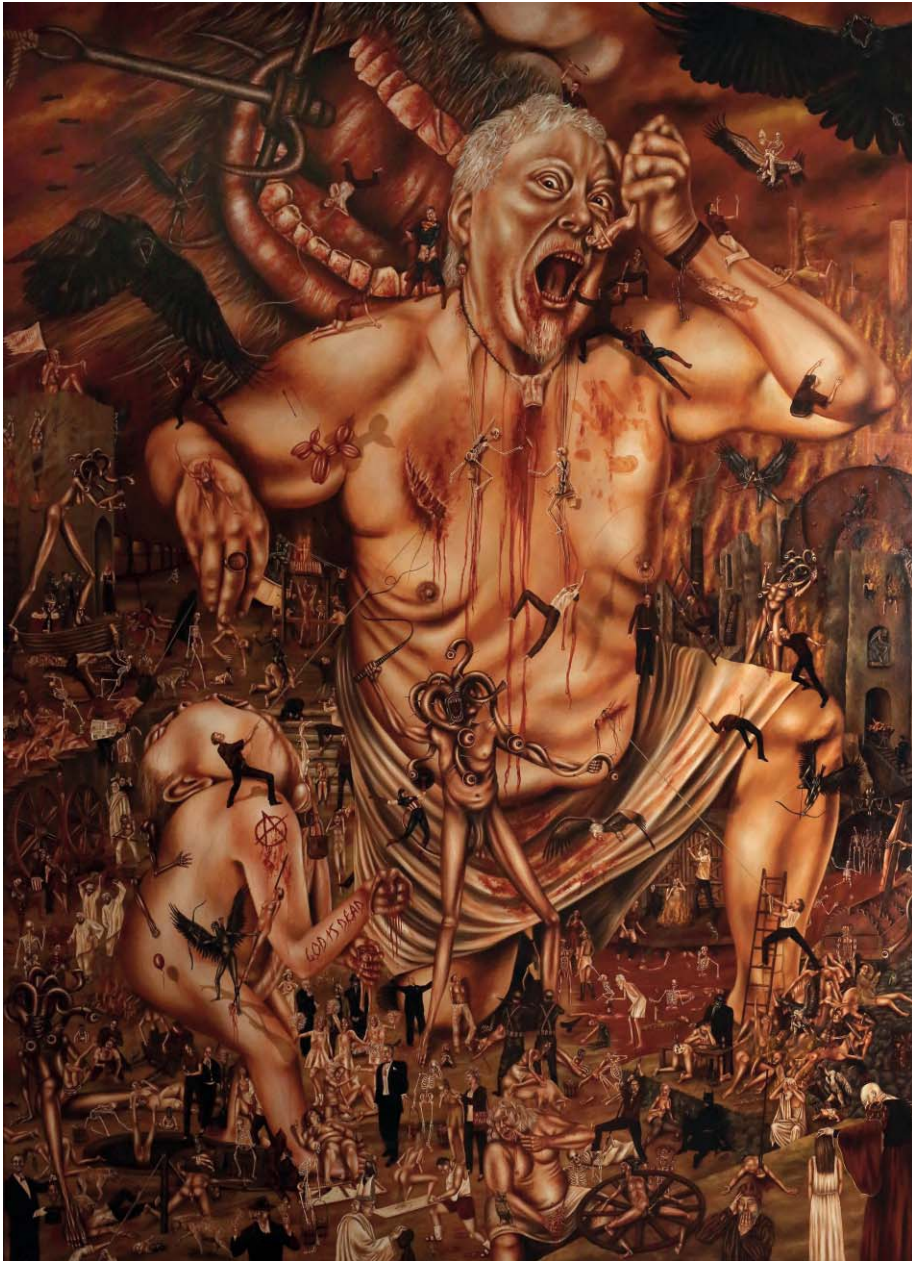
Weltenfresser (zwischen Wahn und Wirklichkeit) - Öl auf Leinwand - 220 x 160 cm World Eater (between delusion and reality) - Oil on Canvas - 220 x 160 cm