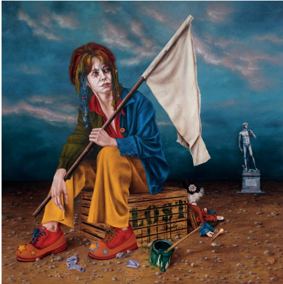
Verloren - Öl auf Leinwand - 80 x 80 cm Lost - Oil on Canvas - 80 x 80 cm