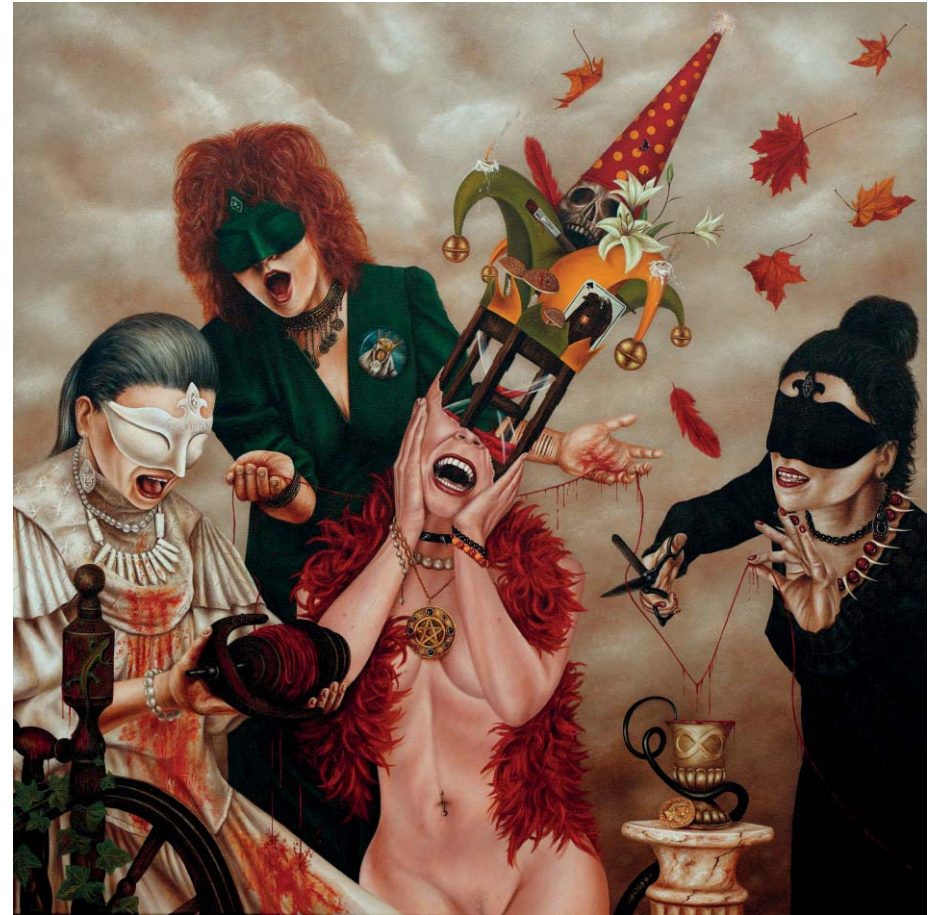
Der Schrei - Öl auf Leinwand - 80 x 80 cm The Scream - Oil on Canvas - 80 x 80 cm