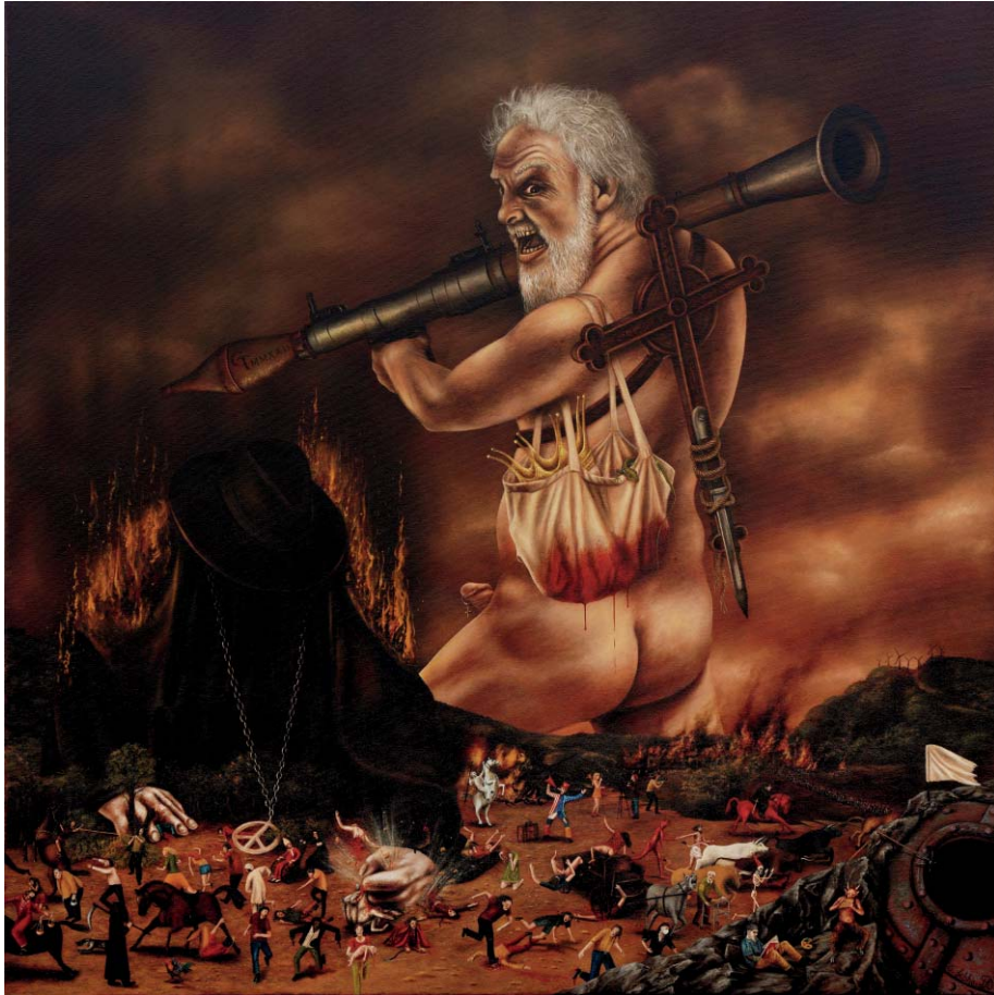
Der Koloss - Öl auf Leinwand - 80 x 80 cm The Colossus - Oil on Canvas - 80 x 80 cm