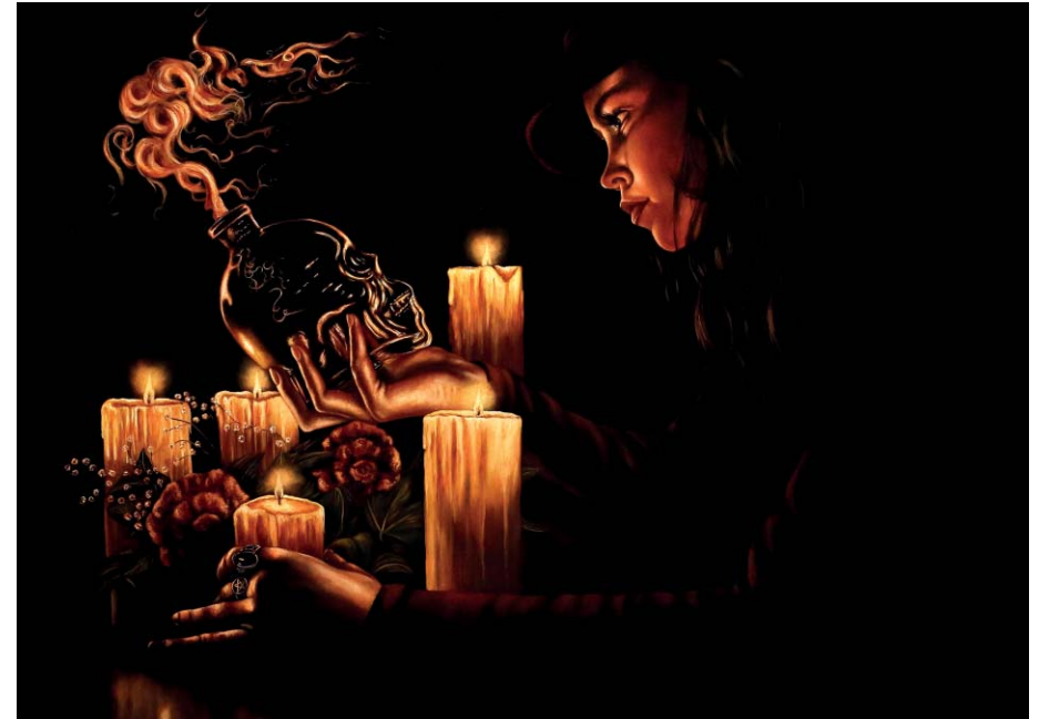
Aus der Serie Memento Mori - Öl auf Leinwand - 60 x 80 cm