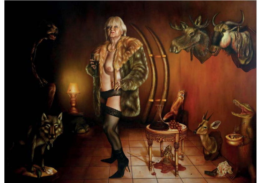
Spiegeln, Spiegeln an der Wand - Öl auf Leinwand - 150 x 200 cm Mirror, Mirror on the Wall - Oil on Canvas - 150 x 200 cm