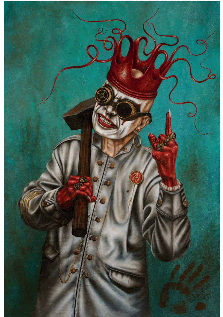
Der Zelebrant - Öl auf Leinwand - 70 x 100 cm The Celebrant - Oil on Canvas - 70 x 100 cm