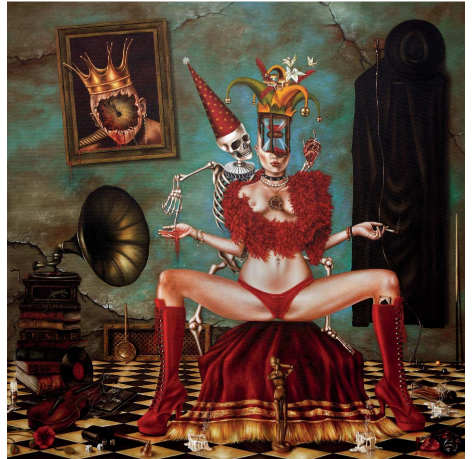
Die geile Zeit - Öl auf Leinwand - 100 x 100 cm The great time - Oil on Canvas - 100 x 100 cm