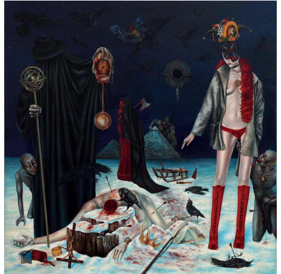
Die Enthauptung der Unendlichkeit - Öl auf Leinwand - 80 x 80 cm The Decapitation of Infinity - Oil on Canvas - 80 x 80 cm