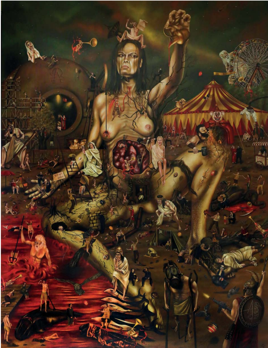
Gaias Erben - Öl auf Leinwand - 150 x 200 cm Gaia's Heirs - Oil on Canvas - 150 x 200 cm