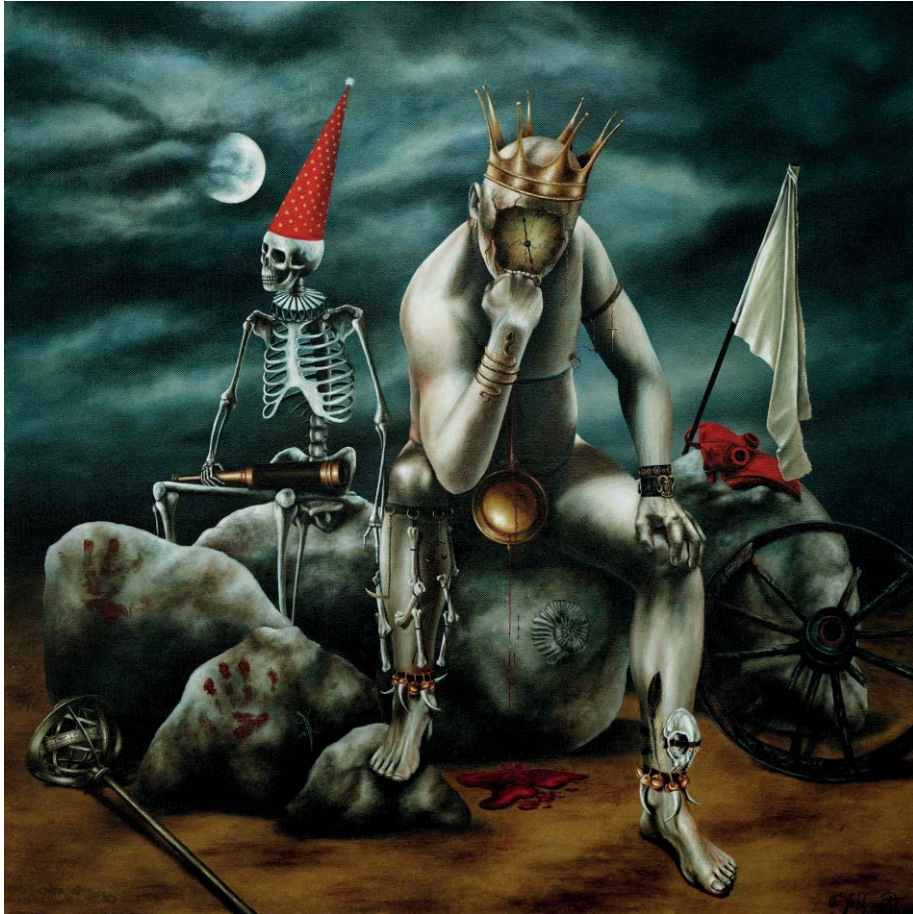
Der Denker - Öl auf Leinwand - 80 x 80 cm The Thinker - Oil on Canvas - 80 x 80 cm