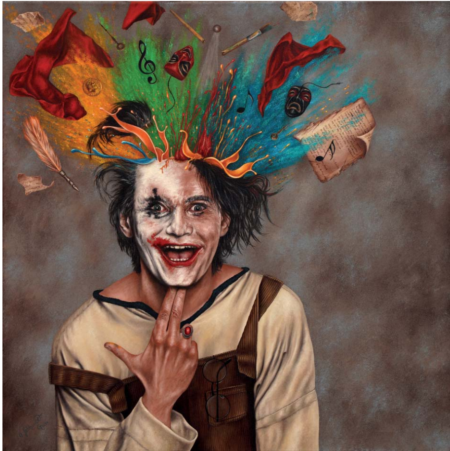
ZEIT:DRIVER - MINDS UNLOADED - Oil on Canvas - 80 x 80 cm