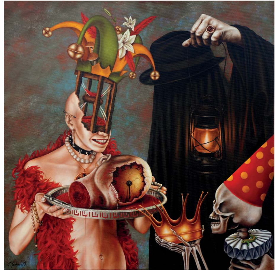
Das Haupt eines Königs - Öl auf Leinwand - 80 x 80 cm A king's head - Oil on Canvas - 80 x 80 cm