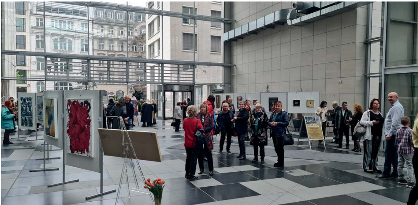
Atrium Kunsthalle Art Berlin City

Atrium Internationales Handeszentrum Friedrichstr. 95 | 10117 Berlin U/S-Bhf Friedrichstraße, Tram, Bus