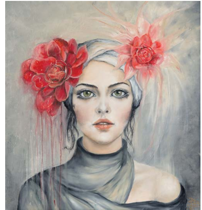
Doris Breuer | blooming essence | ÖL/LW | 70x75cm

Galerie Dikmayer Berlin Mitte http://www.galerie-dikmayer.de Gallery 0049-30-23 29 20 60 Mobil 0049-177-2009132 Germany