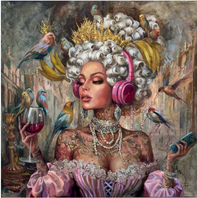
Simone Campos | Flying Bird | Öl&Acryl auf Leinen | 150x150cm