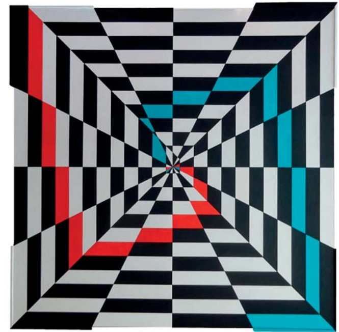
Bernd Schiller - Im Mahlstrom Acryl/ Passepartoutkarton/Auf Hartfaser | 95,5x95,5 cm

Internationale Messe für zeitgenössische Kunst & Design international exhibition since 1999 Vernissage: 17.05.2025 um 15 Uhr