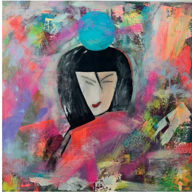
Caren Cunst | Die Welt steht Kopf | Öl/LW | 100x100cm