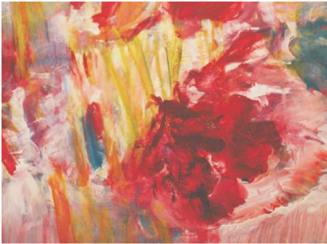
Jutta Maria Clemens | Naturspiele | Gouaché | 80x100cm