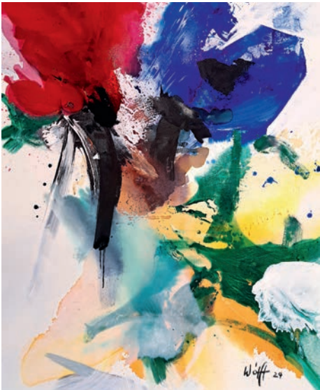
Dietmar Wölfl, „flowersfightforsunshine I“ 2025, Mischtechnik auf Leinwand, 140 x 100 cm, Global Art Solution, D-Bassum