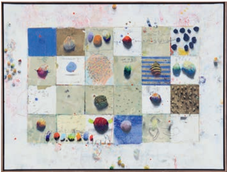
Cole Morgan, „Dance“ 2025, Mischtechnik auf Leinwand, 75 x 100 cm, Blue Art, CH-Interlaken