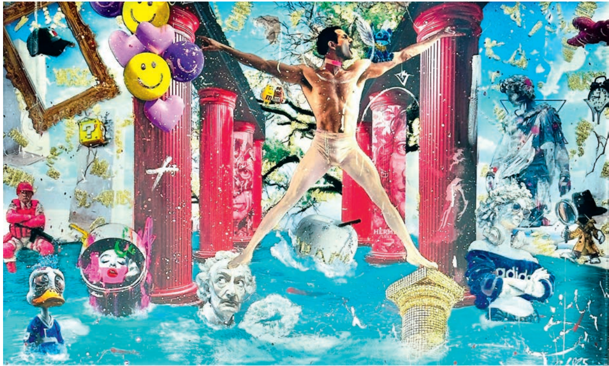
BabyD, „PROTAGONISM!“ 2025, Mixed Media, 160 x 100 cm (Ausschnitt), ART LAB, I-Ponzano

K unst ist mehr als ästhetischer Genuss. Sie ist ein Resonanzraum für unsere Gesellschaft, sie spiegelt nicht nur, was ist, sie eröffnet auch, was sein könnte. Sie lädt ein, Fragen zu stellen, Unsicherheit auszuhalten und im Dialog zu bleiben. Kunst ist kein Luxus, sondern Notwendigkeit. Gerade darf Kunst kein elitärer Elfenbeinturm sein, kein abgeschlossener Raum für Eingeweihte, sondern soll ein niederschwelliger Ort sein, an dem wir uns selbst wiederfinden können.