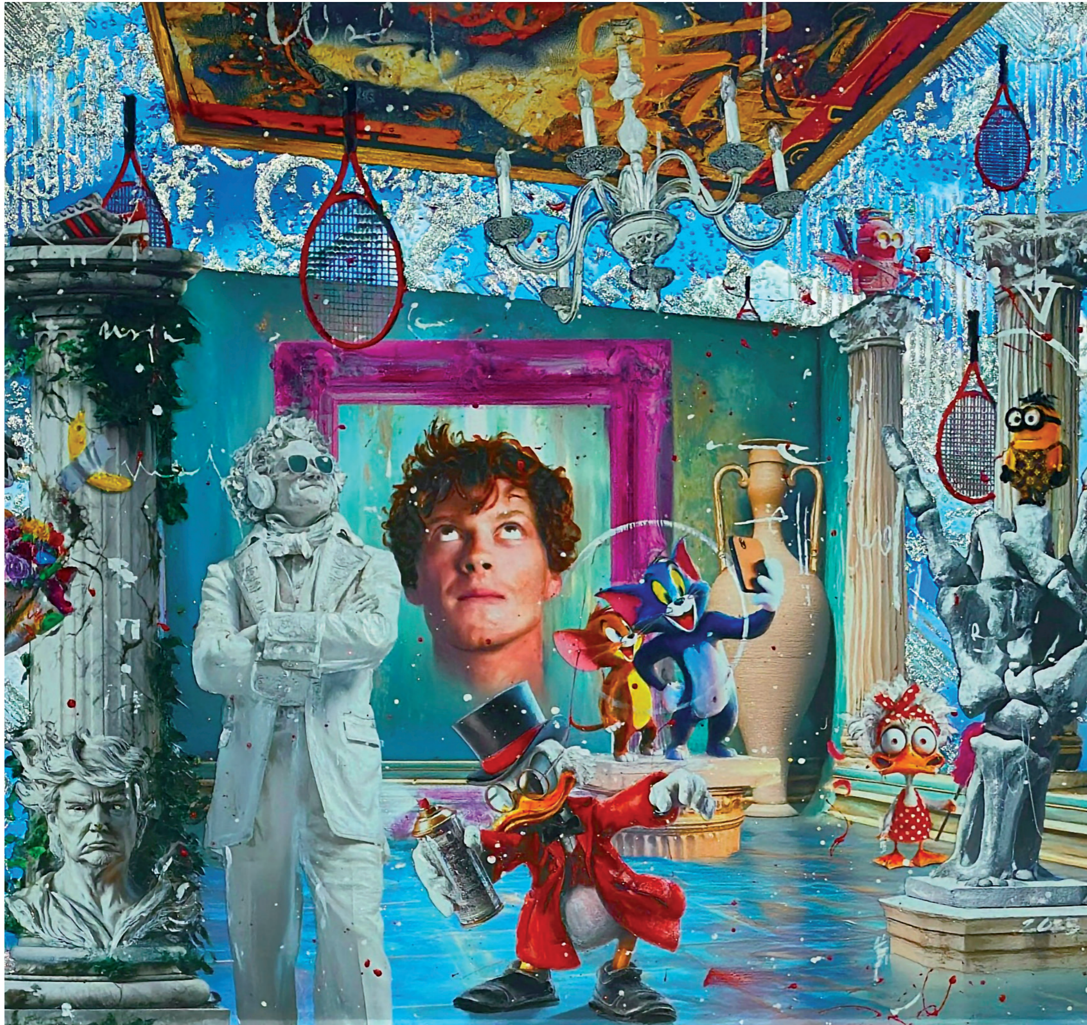
BabyD „DELIRIUM“ 2025, Mixed Media, 160 x 100 cm (Ausschnitt), ART LAB, Ponzano Veneto-IT