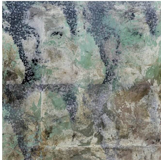
Thorsten Poersch „Beauty VIII“ 2025, Mischtechnik auf Leinwand, 140 x 130 cm, Global Art Solution, Bassum-DE