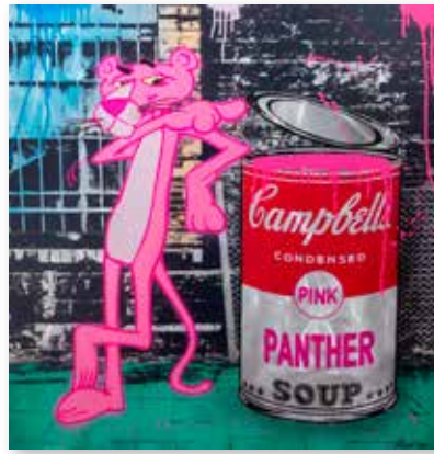
Michel Friess: „Pink Panther Soup“, 2018, Mischtechnik auf Alu, 100 x 100 cm, Art-Galerie am Hofsteig, Wolfurt/AT