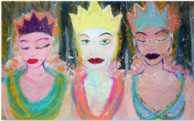
Kiddy Citny: „enfant miraculeux“, 2017, 90 x 120 cm, Acryl an Leinwand, Galerie Queenberg, Salzburg/AT