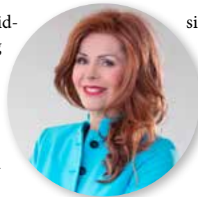
Dir. Johanna Penz

In seiner auf drei Tage angelegten Performance wird Kiddy Citny, der