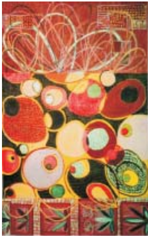
Eliza M. Schmid: "Balloonfantasy" Egg Tempera on panel, 12x7 1/2, 2009