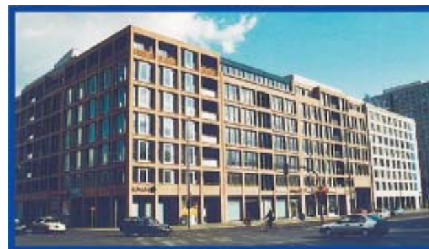
Standort der Messe, Fischerinsel-Passage, Gertraudenstraße 19 10178 Berlin-Mitte, Galerieladen Dikmayer

www.galerie-dikmayer.de · Tel: 0177 - 200 91 32