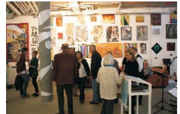
Galerie Dikmayer auf der Fischerinsel in Mitte von Berlin