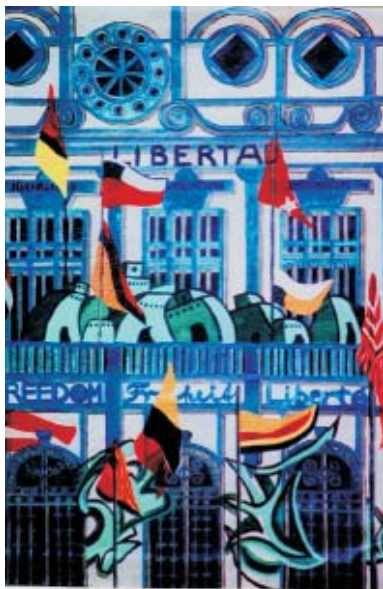
Eliza M. Schmid: "Magie Letters 54" (Reconquest of Liberty) 2009 Acrylie on unstretched canvas, 46x31 inches