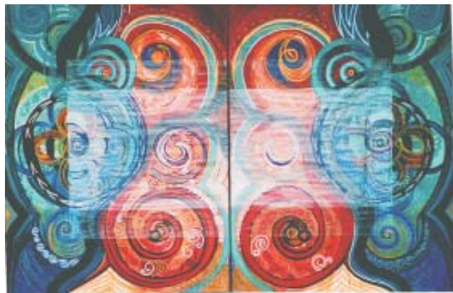
Eliza M. Schmid: "Mandelbrot Sets, III, IV" 2006 Acrylic, Ink on 2 canvases, 24x18 each